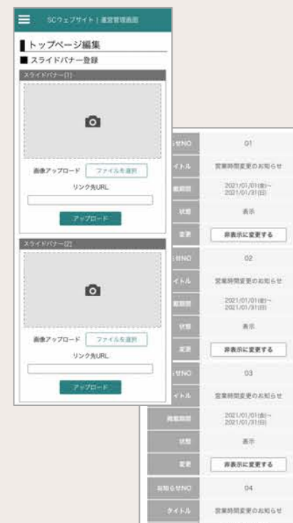
管理画面(更新作業)